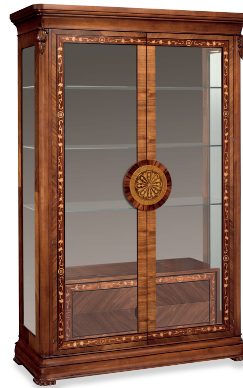
Mod.: 304021 VITRINA CON CAJONES L.: 136 cm. - P.: 55 cm. - A.: 207 cm.