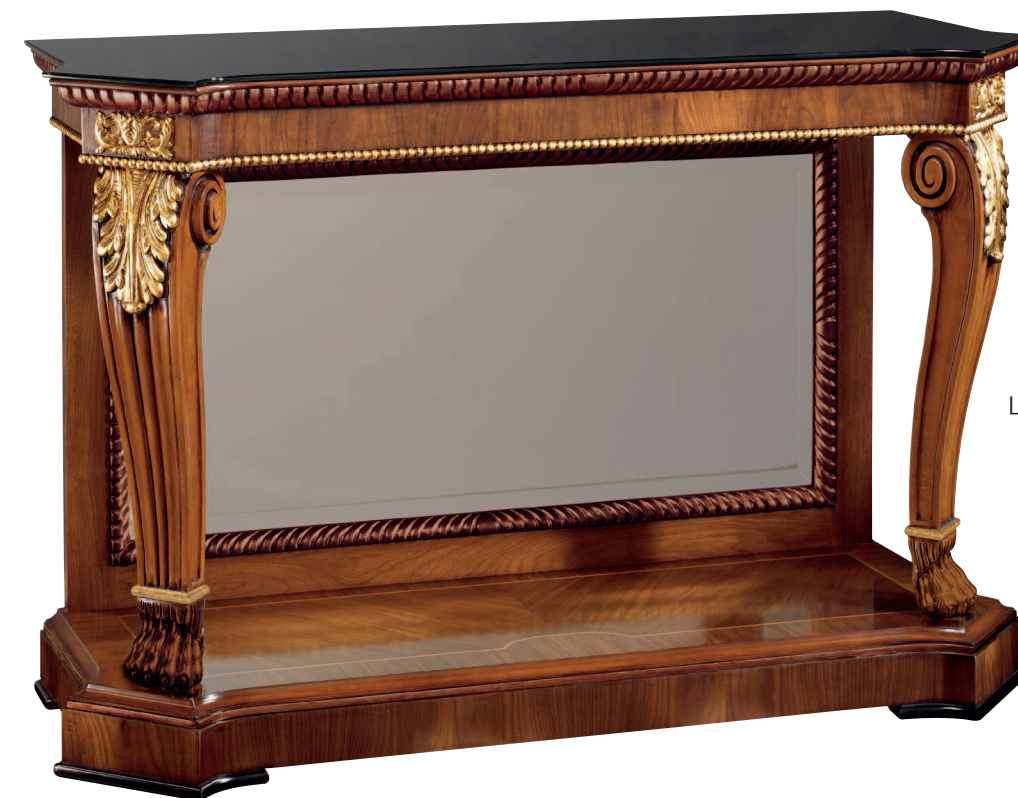
Mod.: 104008 CONSOLA L.: 150 cm. - P.: 55 cm. - A.: 95 cm.