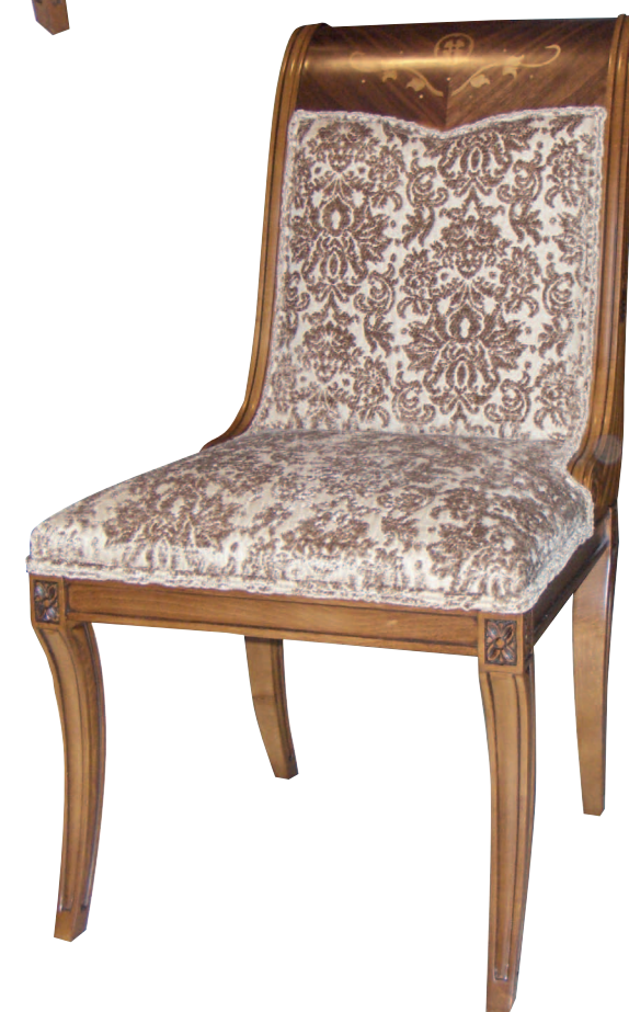
Mod.: 537201 SILLA L.: 54 cm. - P.: 76 cm. - A.: 100 cm.