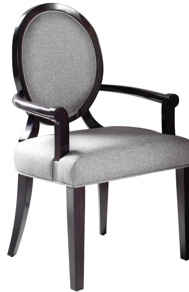
Mod.: 642400 SILLON L.: 63 cm. - P.: 63 cm. - A.: 99 cm.