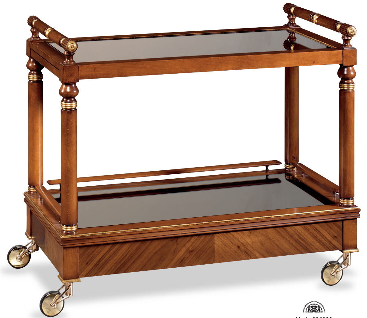
Mod.: 304009 CARRO CAMARERA L.: 100 cm. - P.: 55 cm. - A.: 80 cm.