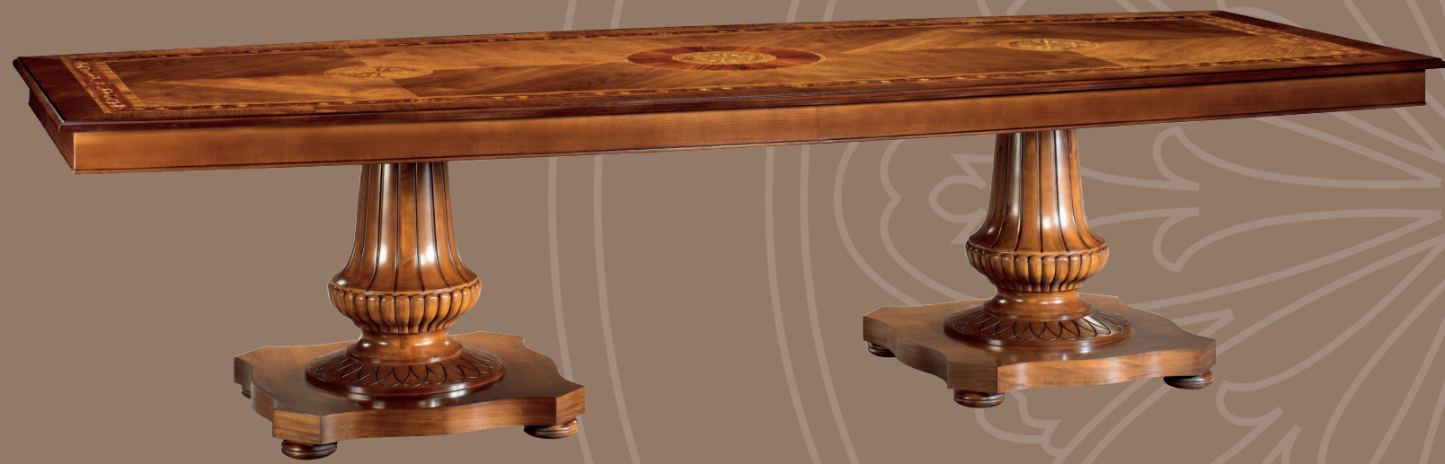
Mod.: 204014 MESA DE COMEDOR L.: 320 cm. - P.: 130 cm. - A.: 76 cm.