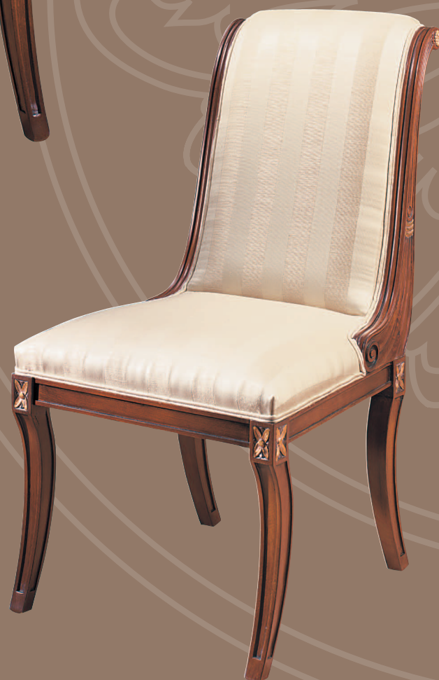
Mod.: 537200 SILLA L.: 54 cm. - P.: 76 cm. - A.: 100 cm. Altura asiento: 51 cm.