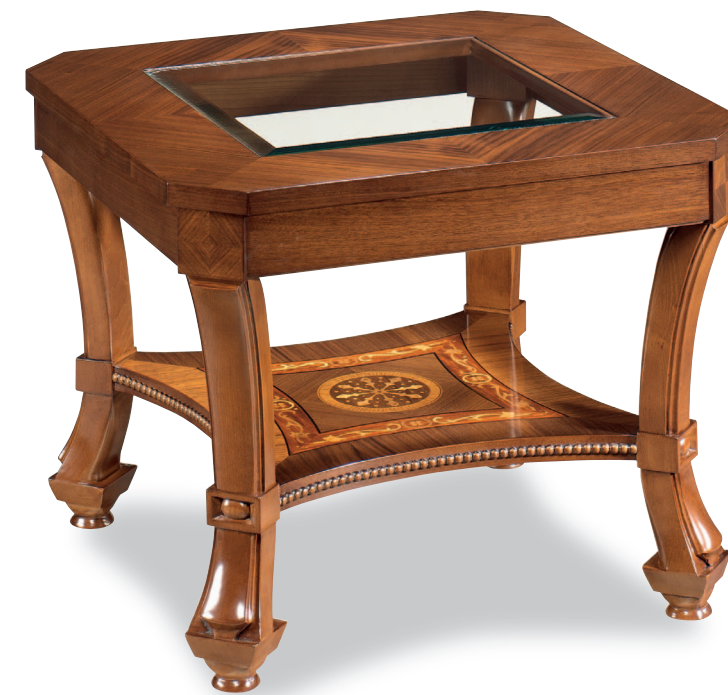
Mod.: 204006 MESA LAMPARA L.: 70 cm. - P.: 70 cm. - A.: 60 cm.