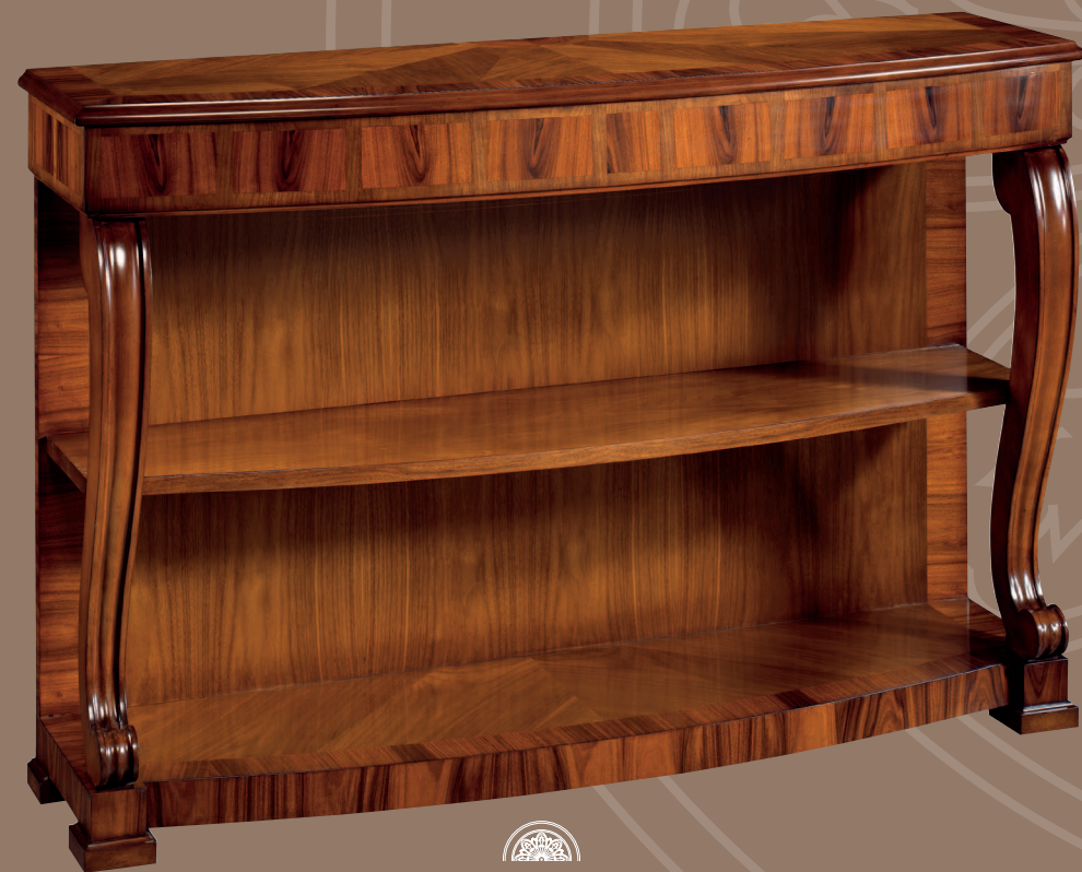
Mod.: 104200 CONSOLA L.: 146 cm. - P.: 45 cm. - A.: 96 cm.