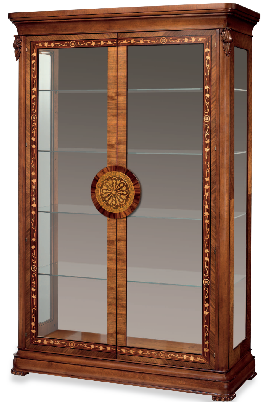
Mod.: 304001 DISPLAY CABINET W.: 53 1/2" - D.: 21 3/4" - H.: 81 1/2"