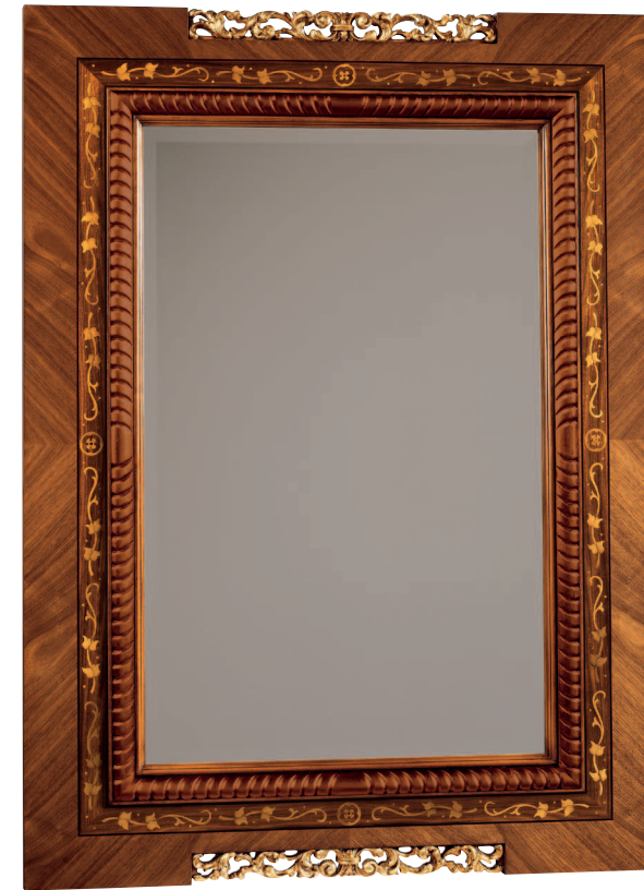
Mod.: 004007 ESPEJO L.: 100 cm. - P.: 4 cm. - A.: 135 cm.