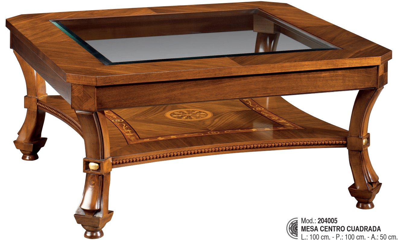
Mod.: 204005 MESA CENTRO CUADRADA L.: 100 cm. - P.: 100 cm. - A.: 50 cm.