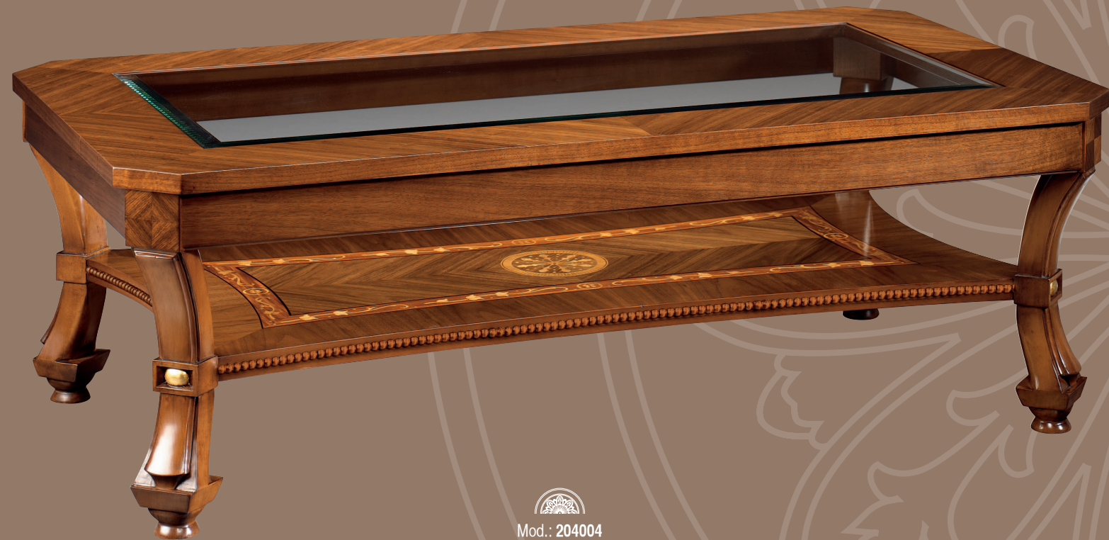
Mod.: 204004 MESA CENTRO RECTANGULAR L.: 140 cm. - P.: 80 cm. - A.: 50 cm.