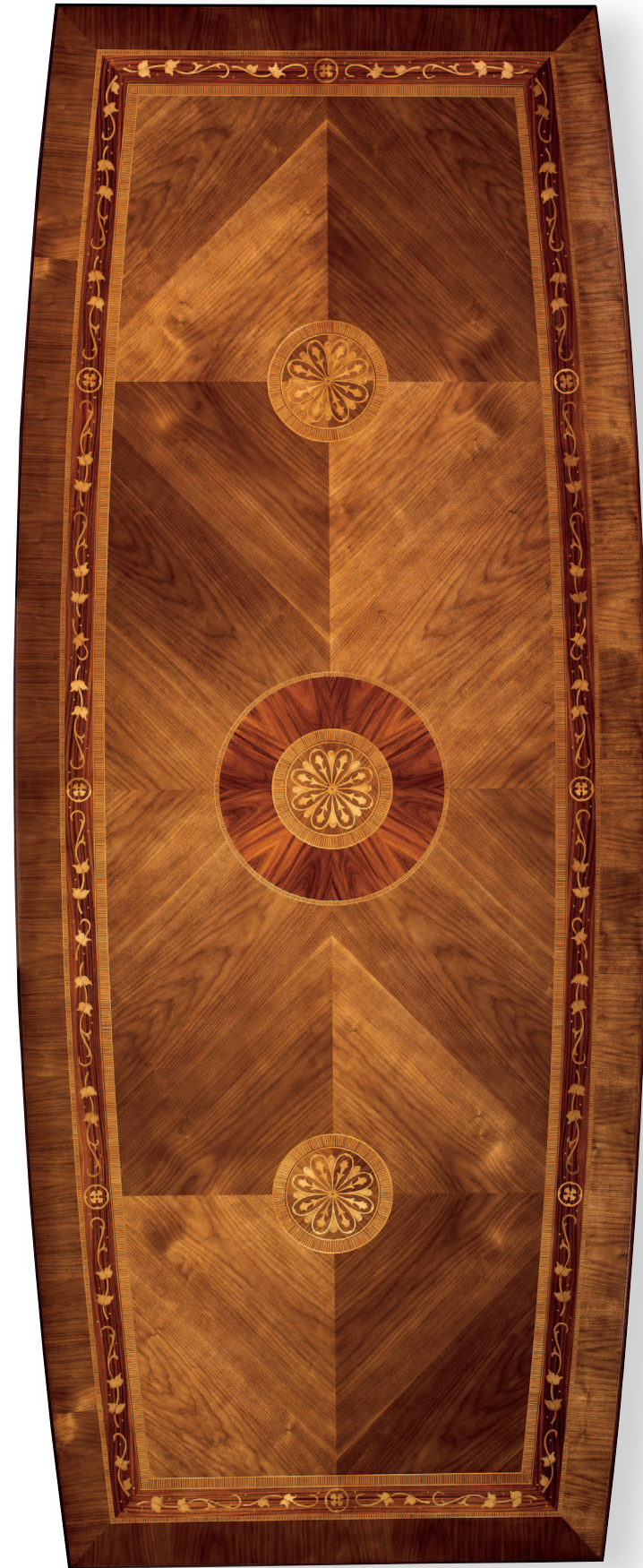
Mod.: 204014 DINING TABLE W.: 126" - D.: 51 1/4" - H.: 30"