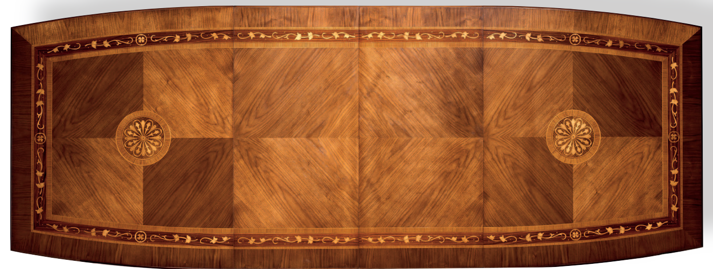
Mod.: 204018 MESA DE COMEDOR L.: 200 cm. - P.: 119 cm. - A.: 76 cm. Extensible (2 hojas x 56 cm.) Total 312 cm.