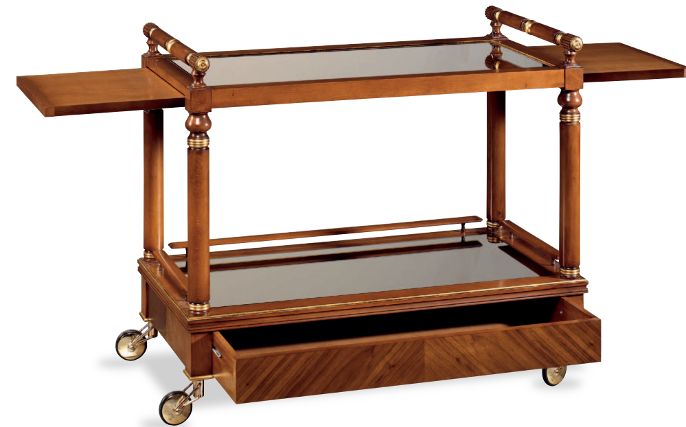
Mod.: 304009 TEA CART W.: 39 1/4" - D.: 21 3/4" - H.: 31 1/2"