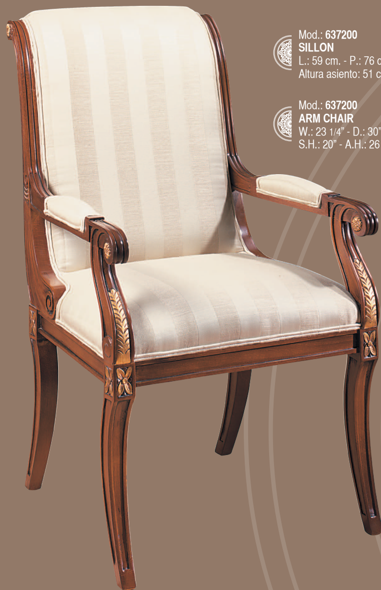
Mod.: 637200 SILLON L.: 59 cm. - P.: 76 cm. - A.: 100 cm. Altura asiento: 51 cm. - Altura brazo: 68 cm.