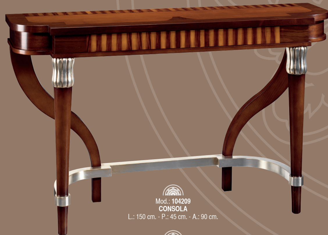
Mod.: 104209 CONSOLA L.: 150 cm. - P.: 45 cm. - A.: 90 cm.