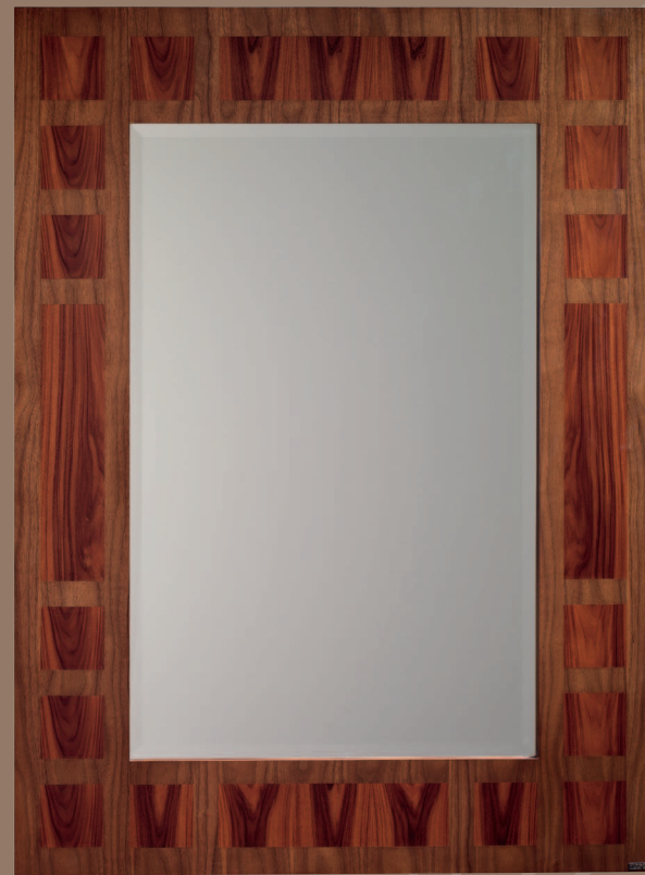
Mod.: 004200 ESPEJO L.: 100 cm. - P.: 3 cm. - A.: 135 cm.