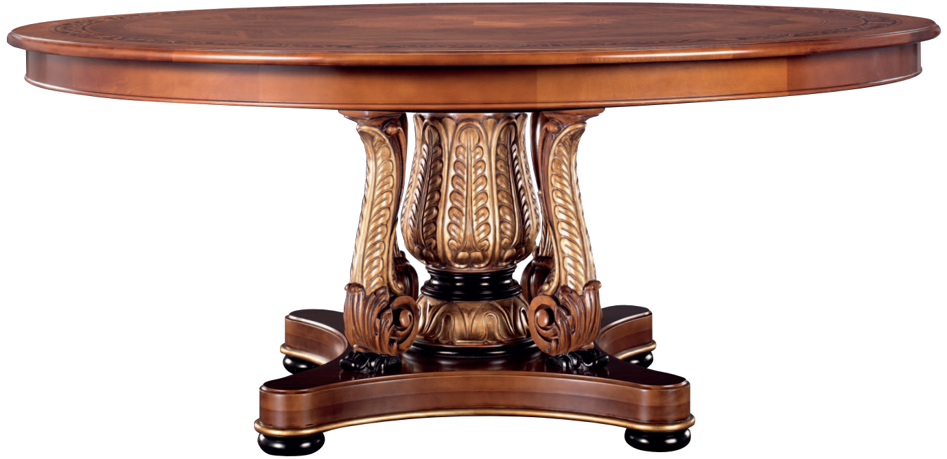
Mod.: 202671 MESA ø 150 cm. - A.: 75 cm.