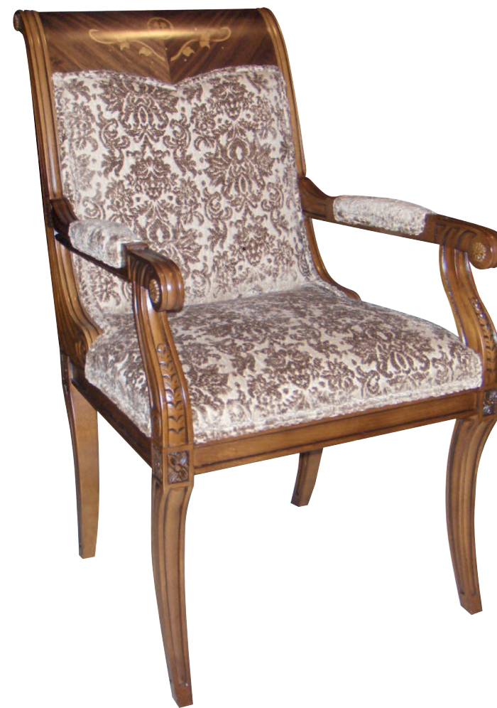
Mod.: 637201 SILLON L.: 59 cm. - P.: 76 cm. - A.: 100 cm.